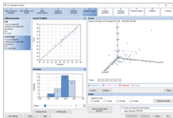
Fig. 1: SL Calibration Wizard, Schritt 6 Kalibrationsergebnisse mit 3D Scores-Grafik

SL Calibration Wizard, stage 6 calibration results with 3D scores plot